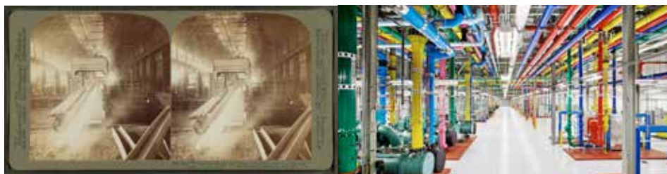
Steel Works, Pittsburg, från Robert N Dennis collection of stereoscopic views. Wikimedia

Industrier besöktes rent fysiskt, men bilder från miljöerna förmedlades även i medierad form. Med hjälp av den tidens tekniker för upplevelseproduktion, till exempel kameror och stereoskop, visades bilder tagna i fabriker. Det storslagna, det exakta och den enorma skalan betonades, och långa rader av maskiner som sträckte sig mot