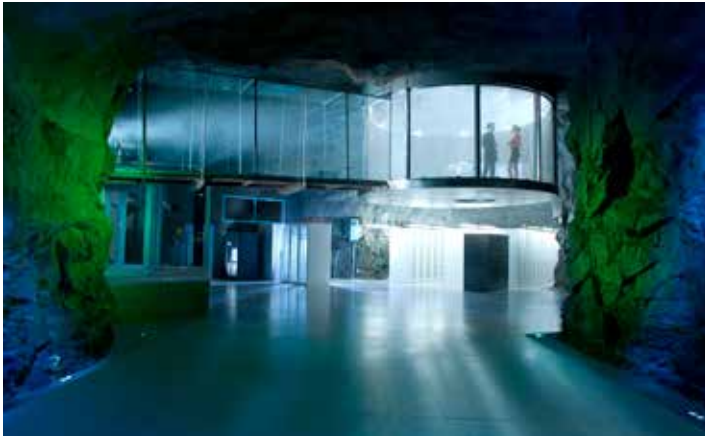
Bahnhof Pionen. www.bahnhof.net

Bahnhofs servrar, som bland annat rymmer materialet från Wikileaks. Just detta material är inte särskilt omfattande när det gäller datamängd, men symboliskt är det desto större. Wikileaks passar också för att bidra till frammanandet av suggestiva bilder av Pionen.