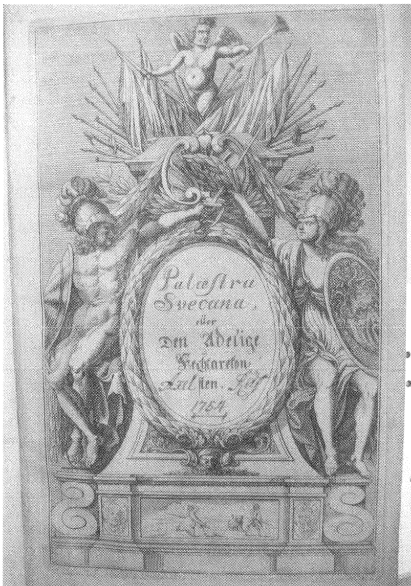
Diedrich von Poraths fäktningsmanual Palestra Svecana eller Den Adelige Fächtare-Konsten (1693).