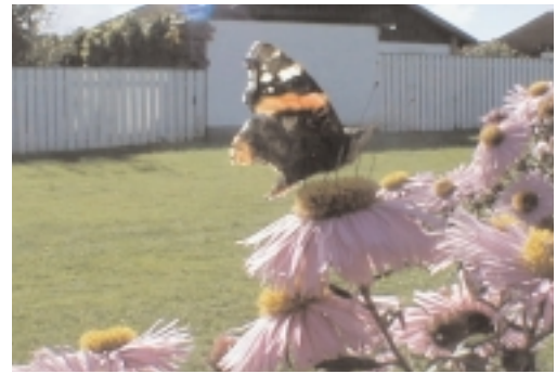
Att minnas namnet på en blomma.