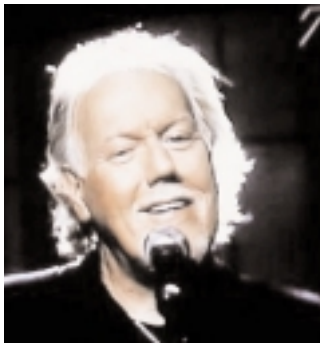
Sett på TV.