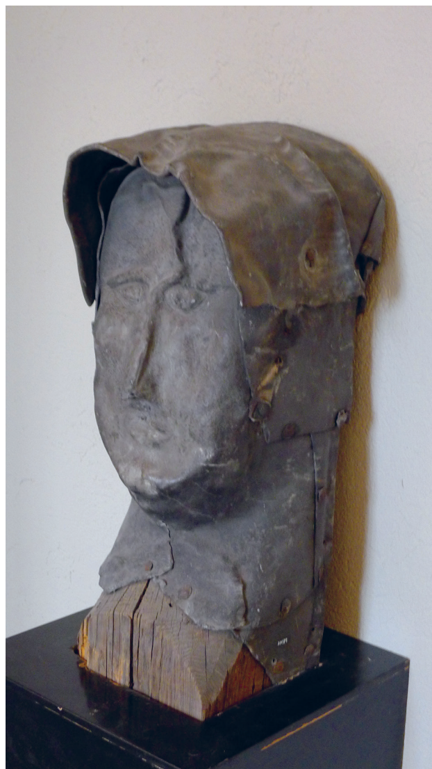
Figur 3. Huvud från absidtakets nock skulpterat i blyplåt i Domkyrkomuseet. Foto: Thomas Rydén, 2015.