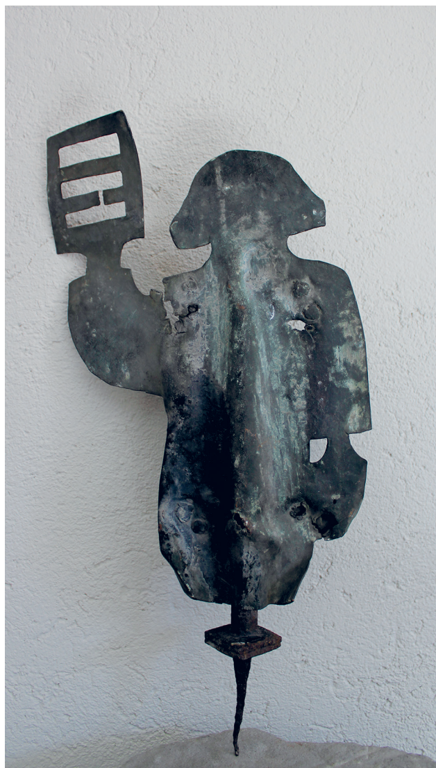
Figur 2. Vindflöjel från norra transeptet i form av S:t Laurentius. Foto: Andreas Manhag, LUHM, 2014.

Det finns exempel på liknande blyhuvuden på några bornholmska kyrkor, i Ny, Nylars och Østerlars, där den uppstickande delen av mittbjälken i absidens takkonstruktion, "kongen", upptill är klädd i blyplåt. I några fall är denna utformad som ett huvud (DK VII: 211, 260, 383ff). Huvudet på Nylars kyrkas absid är mest detaljerat, klätt i en bredbrättad hatt och tydligt manligt, till skillnad från Lunds domkyrkas blyhuvud. Huruvida det finns något samband mellan huvudena på de bornholmska kyrkorna och Lunds domkyrka är oklart, men takstolarna är omarbetade vid olika tillfällen. En 1500-talsdatering vore där-