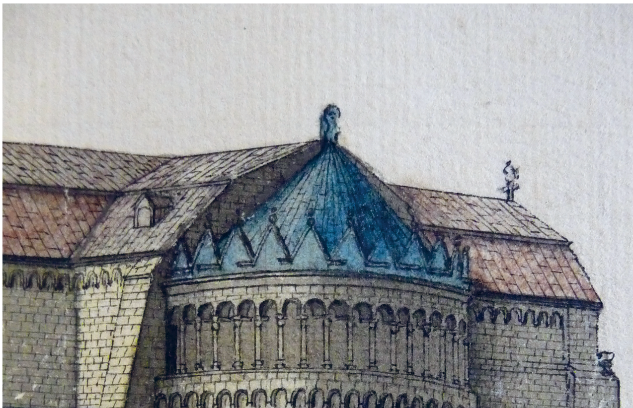
Figur 4. Lunds domkyrkas absid. Akvarellerad teckning av E. Nielsen 1836 i Kyrkoarkivet LUHM. Foto: Andreas Manhag, 2014.

för inte osannolik. Placeringen av något slags huvud, av en människa eller ett djur, förekommer dock även i andra material under hela medeltiden. Tolkningarna av de bornholmska huvudena är ibland något fantasirika. Även om det inte går att bestämma åldern på dem, kan man dock konstatera att den bredbrättade hatten snarast kan liknas vid en baret. Dessa bars under slutet av medeltiden och under renässansen, och i så fall torde kunna betraktas som en gestaltning av dess egen funktionella benämning ”konge”.