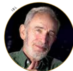
Paul Ehrlich (1932–). Amerikansk biolog vid Stanforduniversitetet. Debattör i miljö- och befolkningsfrågor.

Frågorna är svåra att besvara på ett tillfredsställande sätt. Än så länge är det relativt få historiker som på allvar har gett sig i kast med dem. Det är ingen tvekan om att dessa rymdbilder av vår planet har fått stor spridning och att de tidigt kom att omhuldas av miljöroelsen. Men om det moderna miljö- →