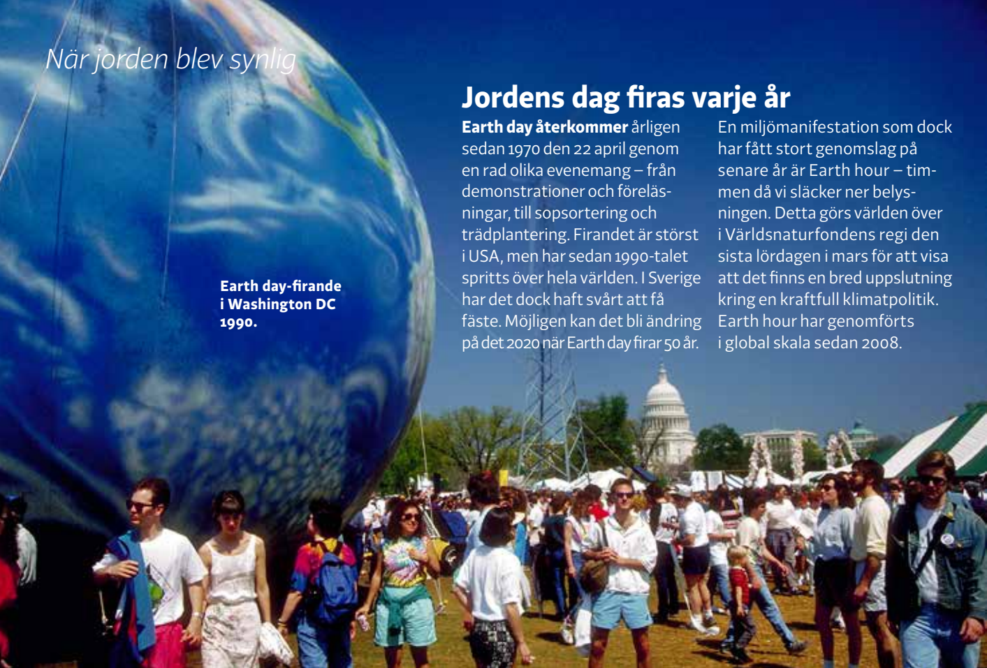
Earth day-firande i Washington DC 1990.