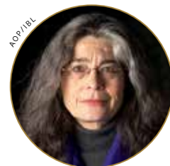
Stephanie Mills (1948–). Miljöaktivist och författare, känd för att hon i sitt avslutnings-tal från Mills College 1969 deklarerade att hon inte tänkte sätta barn till världen.