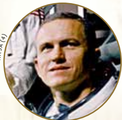
Apollo 8 med sin besättning. Ovanifrån: James A Lovell Jr, William A Anders och Frank Borman.