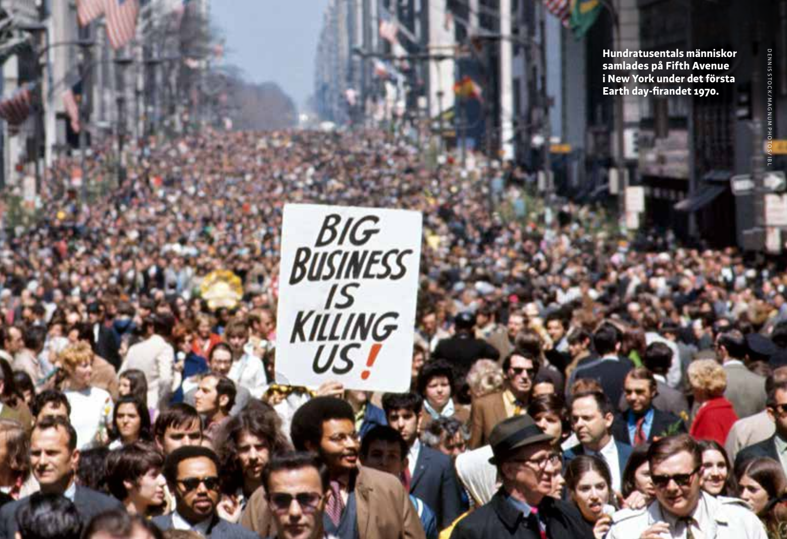
Hundratusentals människor samlades på Fifth Avenue i New York under det första Earth day-firandet 1970.