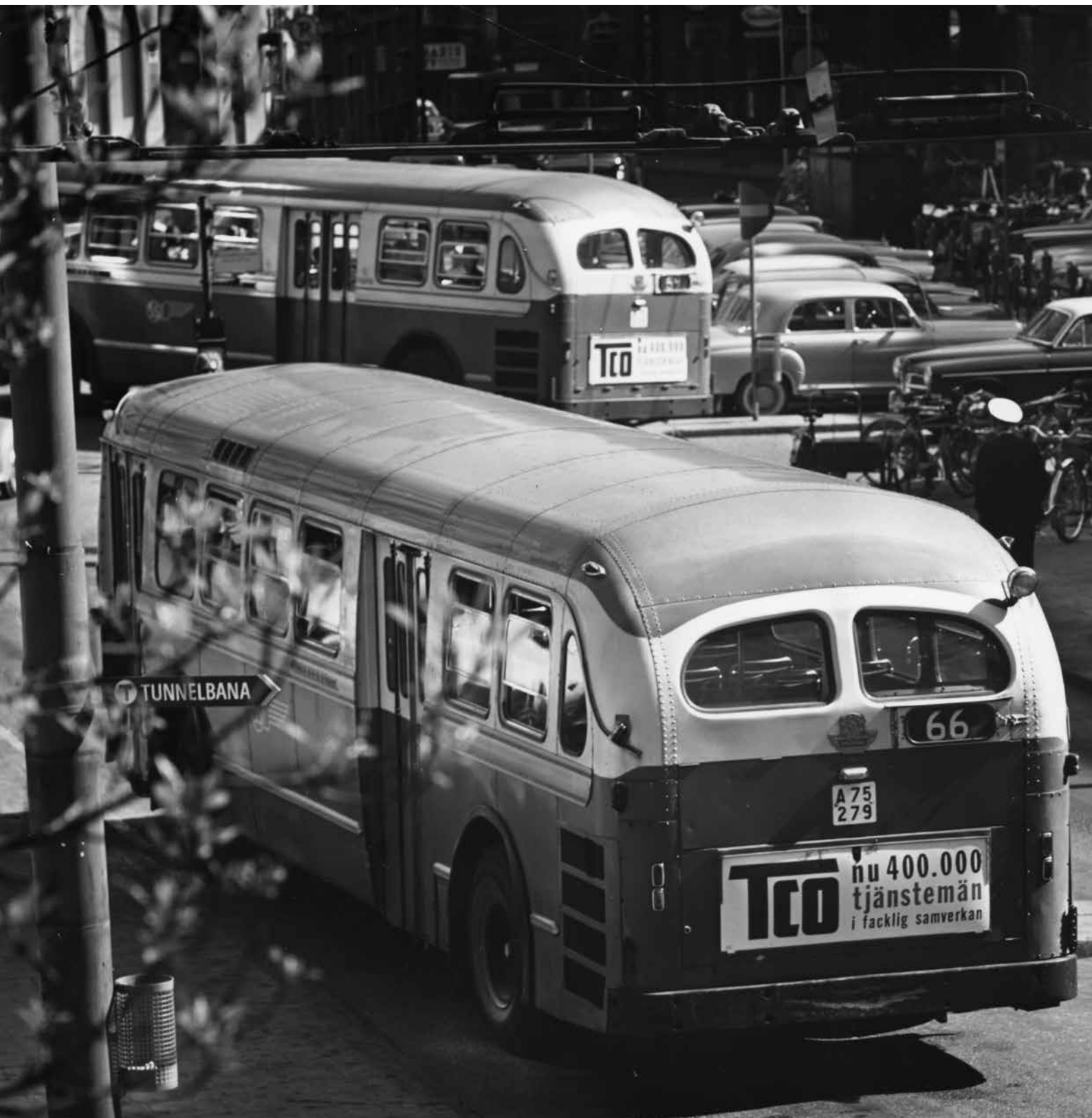
Bussar med TCO-propaganda, 1964.