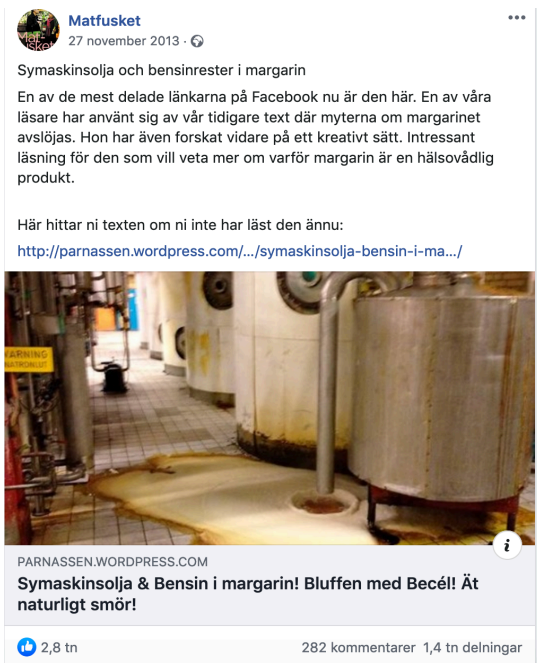
Bild 5: Symaskinsolja och bensinrester i margain (Matfusket, 2013o)

Personen som framhålls som expert är en pensionerad musiklärare som driver en blogg om dieten LCHF. I bloggen som Matfusket hänvisar till framhåller den så kallade experten: