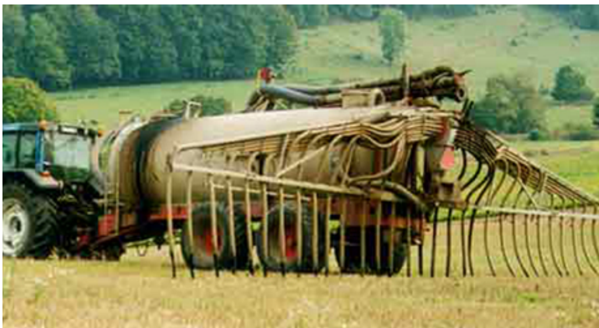
Omslagsbild tagen från biogasportalen.se

Miljövetenskap Examensarbete för kandidatexamen 15 hp Lunds Universitet