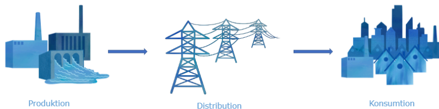
Bild 1: Sveriges historiska elsystem. Bildkälla: PowerCircle. Använd med tillstånd.

Sammanfattningsvis så kan man säga att det svenska elsystemet genomgår ett skifte. Från att traditionellt varit ett linjärt system (Bild 1), där el har producerats centralt, för att sedan distribueras och till sist användas, till ett nytt och mycket mer spretigt system (Bild 2). Detta nya system karaktäriseras av hög komplexitet, där elen kan strömma fram och tillbaka mellan användare, en större andel av prosumenter, fler decentraliserade kraftkällor och hög digitalisering (International Energy Agency, 2025). Det nya, framtida, systemet visualiseras i Bild 2.